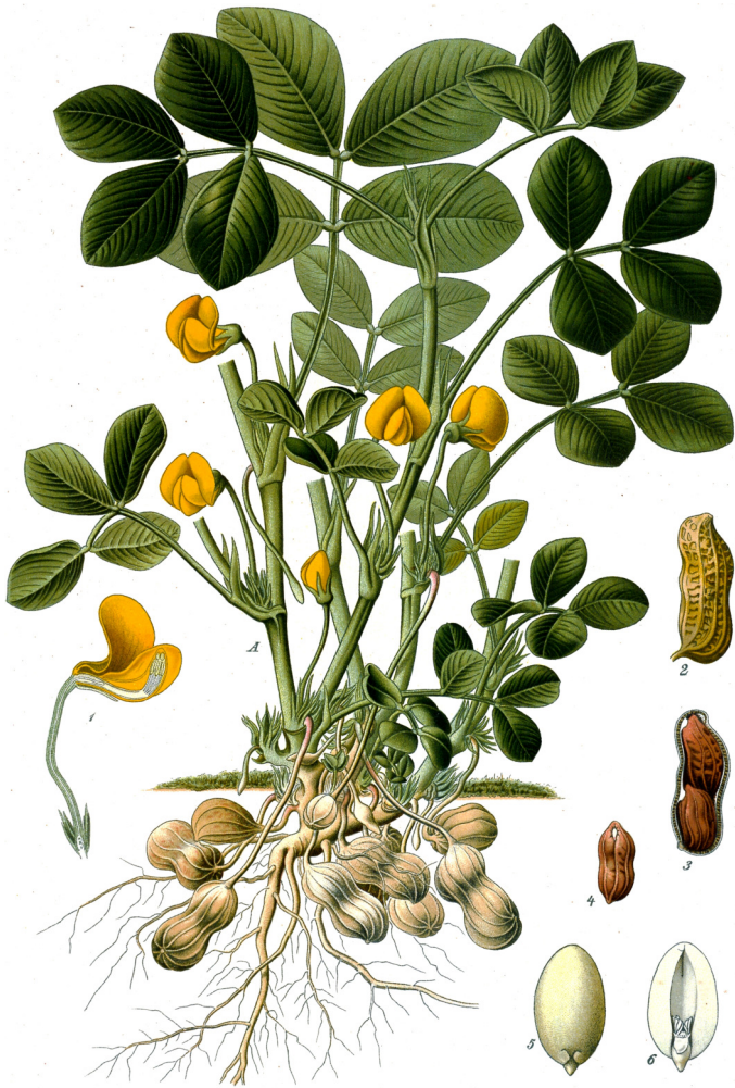
Slika 2: zemeljski orešek ( Arachis hypogaea )