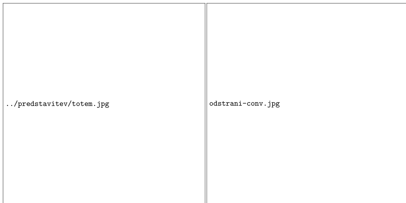
Slika 1: Slika rampe od spredaj

Platenko sem pritr dil na merilno rampo tako, da je v začetni legi stala na pritrjenem nosilcu. Tik nad raketo je bil postavljen merilnik sile.